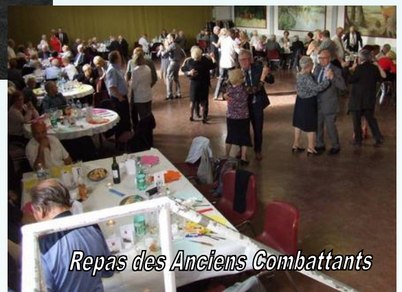
Repas des Anciens Combattants