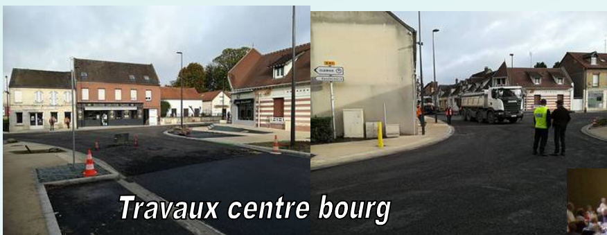
Travaux centre bourg