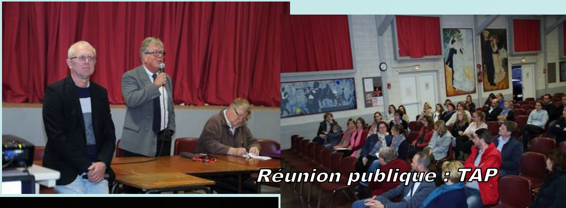
Réunion publique : TAP