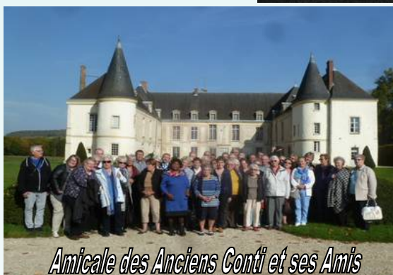
Amicale des Anciens Conti et ses Amis