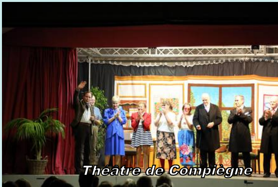
Théâtre de Compiègne