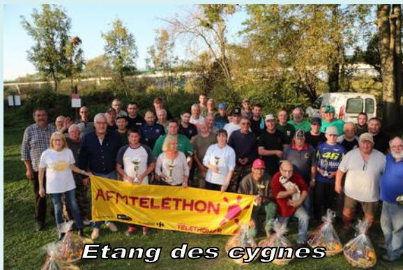
Etang des cygnes