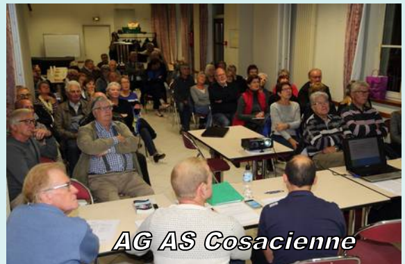
AG AS Cosacienne